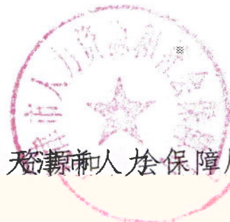
天津市人力资源保障局