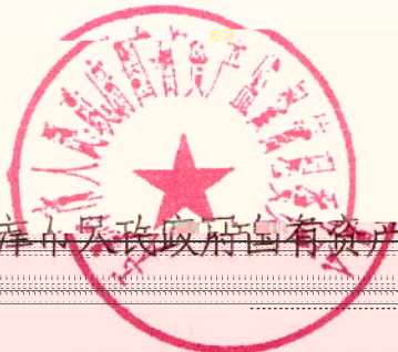
天津市人民政府国有资产